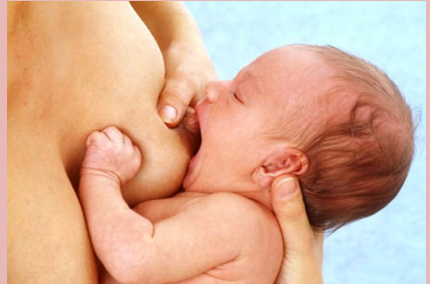
Снизу ареолы видно больше